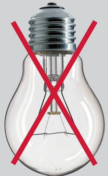
Socket E27 \geq 100 Watt

Beispiele für matte Lampen: in der oberen Reihe (von links) eine Glühlampe matt mit Schraubsockel E 27 und zwei Kerzenglühlampen matt mit Schraubsockel E14, in der unteren Reihe (von links) eine Halogenlampe matt mit Sockel R7s, eine Halogenlampe matt ohne Reflektor mit Sockel G9. Die untere Reihe zeigt rechts außerdem eine Glühlampe klar 100 Watt mit Schraubsockel E27. Diese Lampen stehen für die Gruppe der Lampen, die ab 1. September 2009 nicht mehr in den Verkehr gebracht werden dürfen: matte Glüh- und Halogenlampen sowie klare Glüh- und Halogenlampen mit 100 Watt oder mehr Leistung. Ab diesem Zeitpunkt sind nur noch matte Lampen der Energie-Effizienzklasse A zugelassen, zum Beispiel Energiesparlampen.